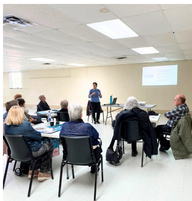
Brin de jasette - Lobe Les Cèdres - Novembre 2023