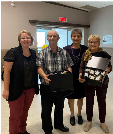
35 e Repas partagés St-Po. Octobre 2023