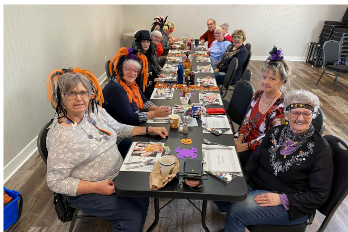
Journée 3D Halloween St-Polycarpe - 31 oct. 2023