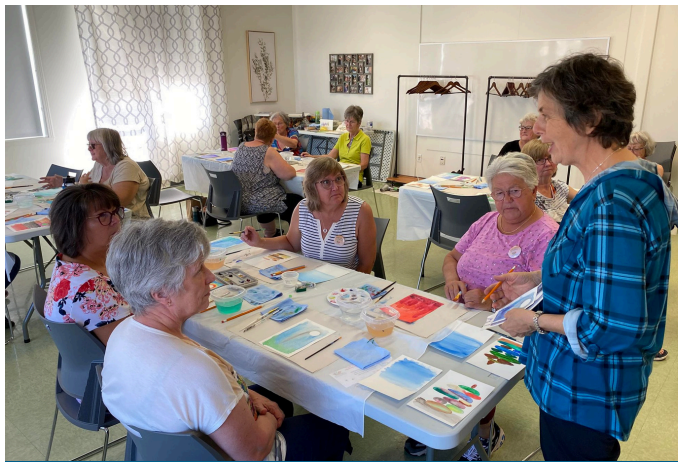
Atelier d'art - Vaudreuil-Dorion Octobre 2023