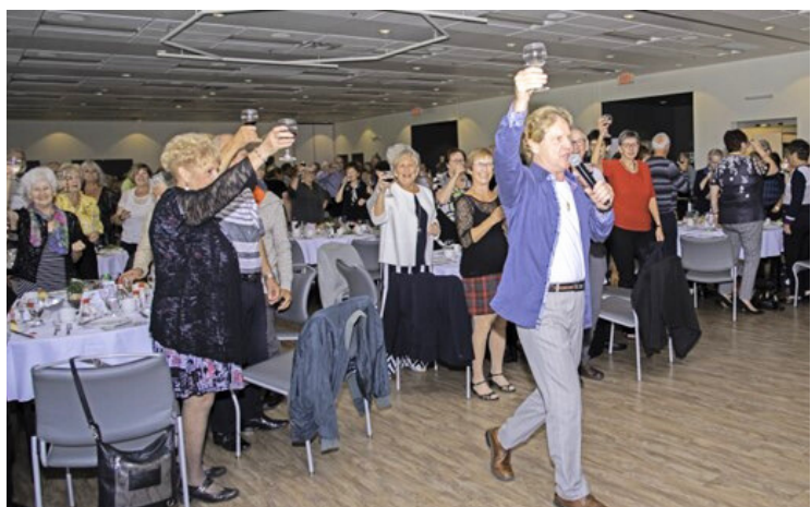
Journée internationale des aînés TCA-VS - 29 sept. 2023