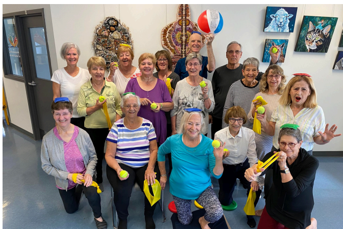
Groupe du programme PIED Vaudreuil-Dorion Octobre 2023