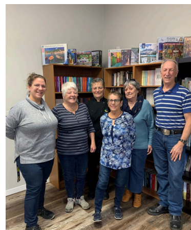
Les comités des repas partagés de Soulanges - 3 nov.