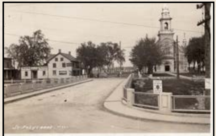
Illustration 3 – Pont construit en 1935 et église

Situé près de la rivière Delisle, ce village possédait notamment, une gare près du chemin de fer du Grand Tronc, une église, 11 magasins, 2 hôtels, une banque (Union), 2 beurreries et une fromagerie. La population était de 400 habitants.