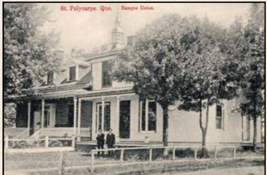
Illustration 4 – Banque Union, ouverte en 1902

Illustrations 3, 4, 5 – collection François Bourbonnais