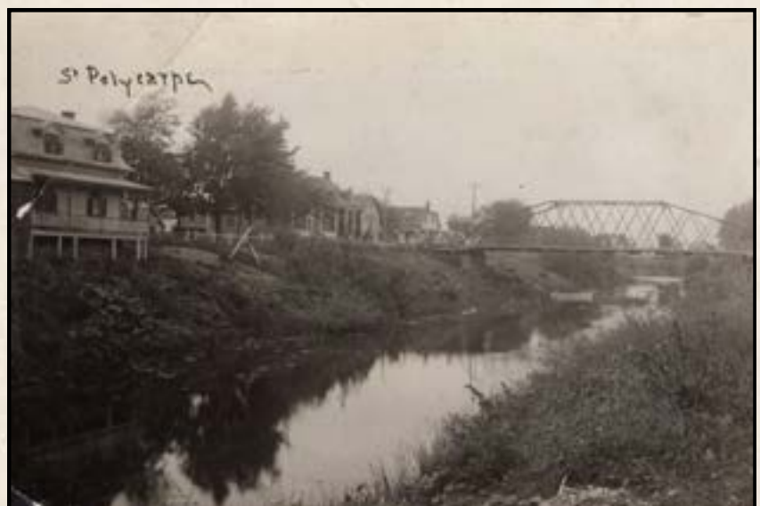
Illustration 5 – Rivière Delisle et le pont de fer