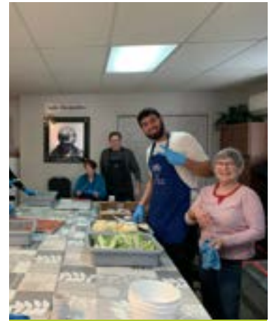
Des bénévoles à St-Polycarpe - Nov. 2023