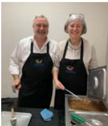
Merci aux bénévoles - Fête de Noël du CCAVS - Déc. 2023