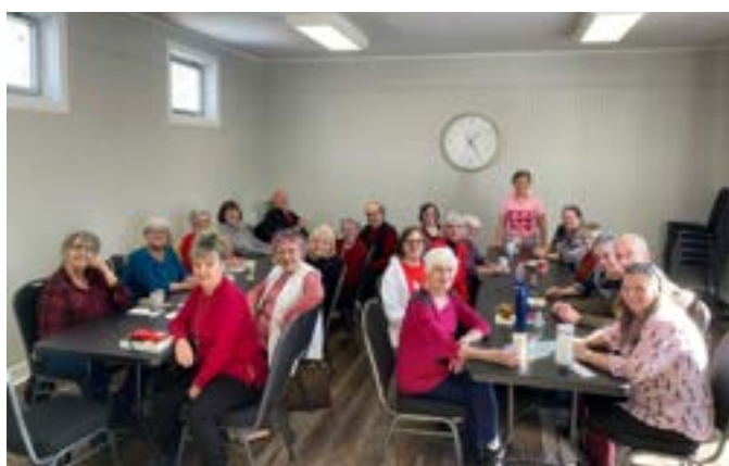
Journée 3D au Pavillon Entre-Nous - 13 février 2024