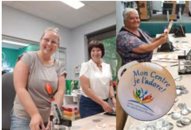
Une partie des bénévoles qui ont collaboré à la confection des 1000 macarons - août/septembre 2023