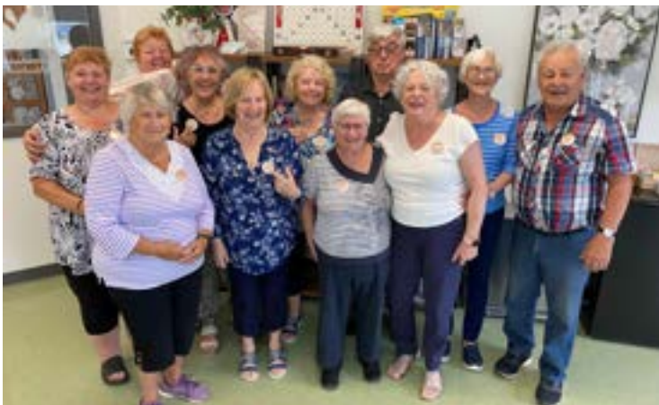
Membres portant fièrement leur macaron durant la Semaine québécoise des centres communautaires - Oct. 2023